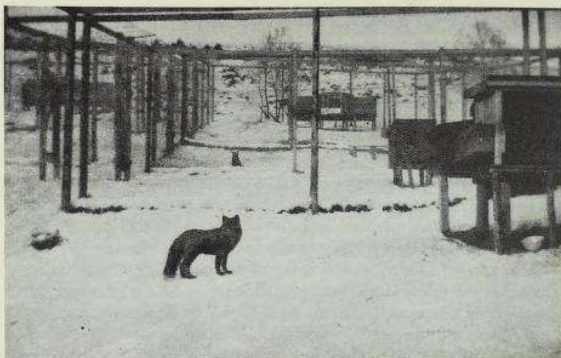
Frå sølvrefarmen til Ivar Storsæter.

Garden tungtbrukt og svært uviss til korn. Brenneved til eige bruk. Har ikkje kvern, heller ikkje har noko kvern vore brukt siste 20 åra. Sår 6\frac{1}{2} t. havre, haustar 20 t. Forar 2 hestar, 16 kyr, 8 ungdyr, 11 sauer, 13 geiter.